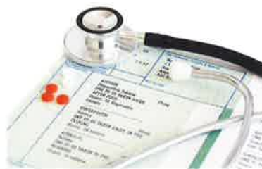
医療費控除をかしこく使おう

人間ドックや健康診断で医師から運動療法を勧められることもあります。その場合の医療費控除を申請するまでの具体的手順を紹介しましょう。