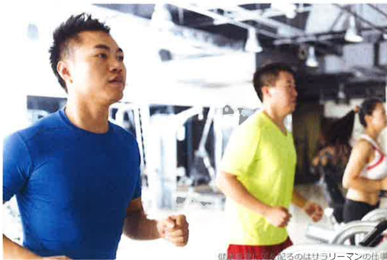
健康診断を受けるのはサラリーマンの仕事の一つ