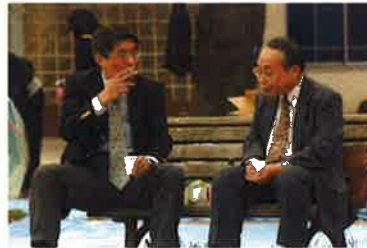
社会的に禁煙の風潮が高まっている

なお、AGA（男性型脱毛症）治療については、治療行為と認められれば医療費控除の対象になります。ただ、一般的には美容目的とみなされるので、対象にするのは難しいケースが多いようです。